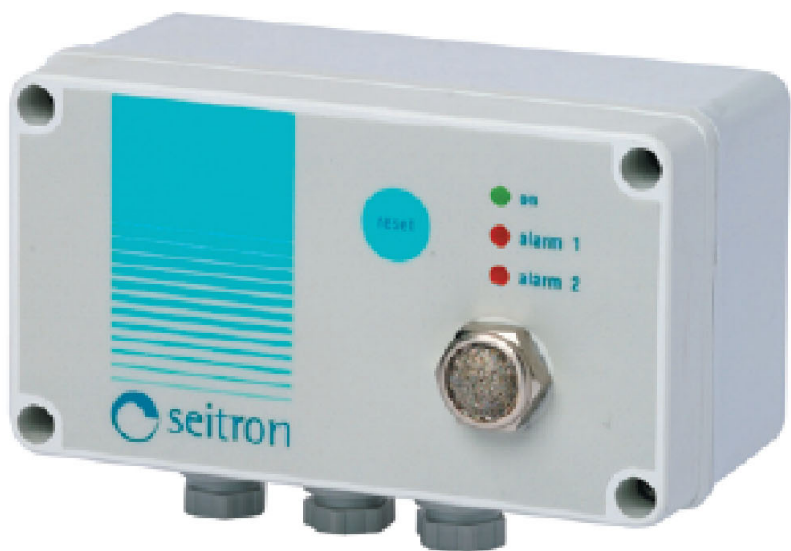
Рис.1 Внешний вид